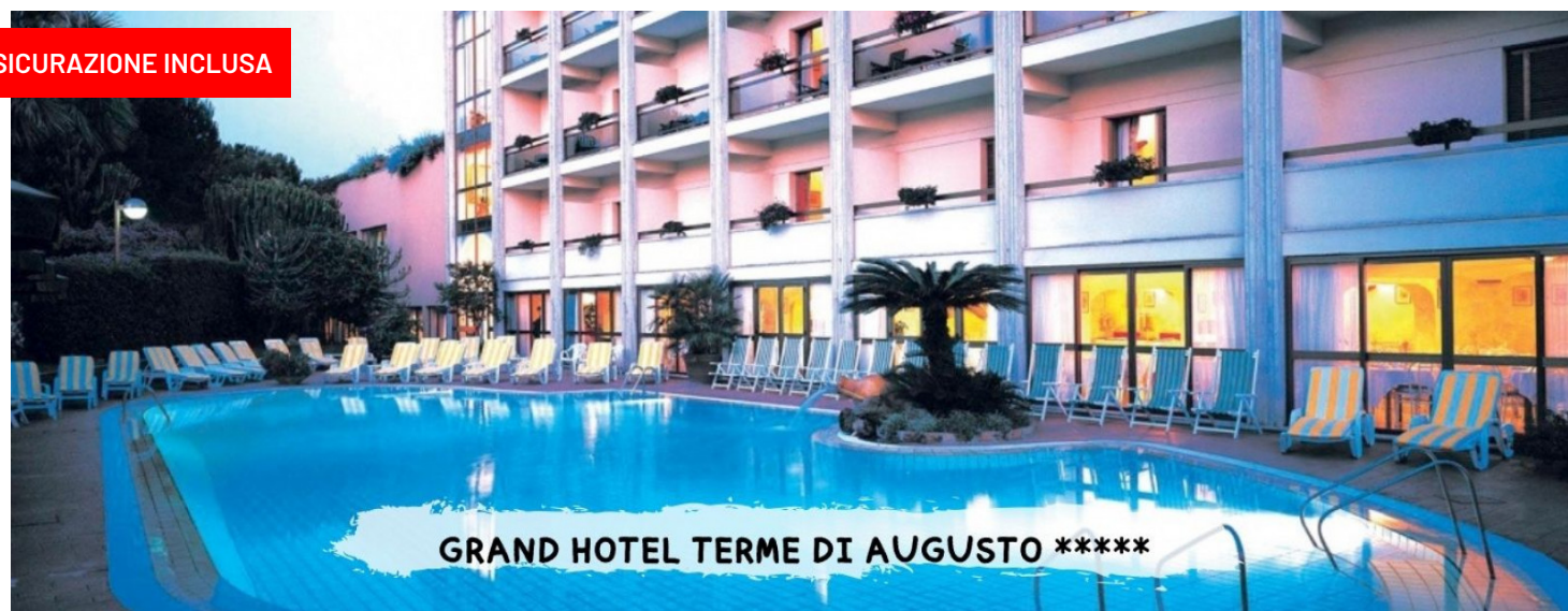
GRAND HOTEL TERME DI AUGUSTO *****