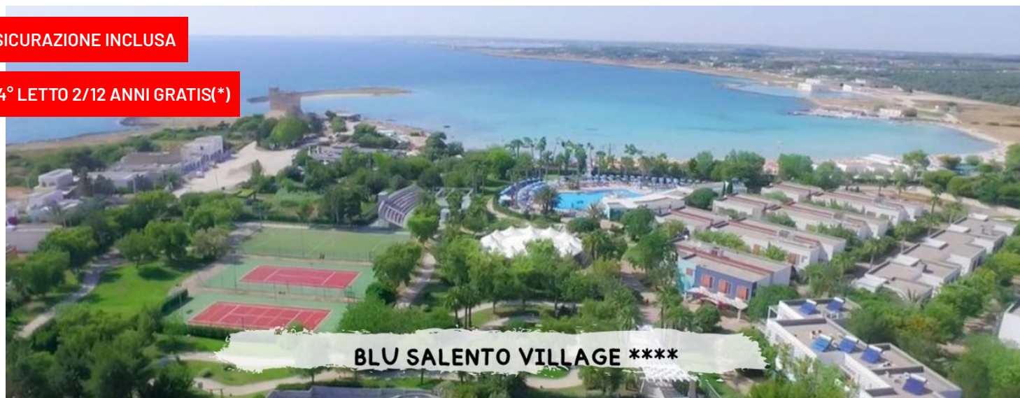
BLU SALENTO VILLAGE ****