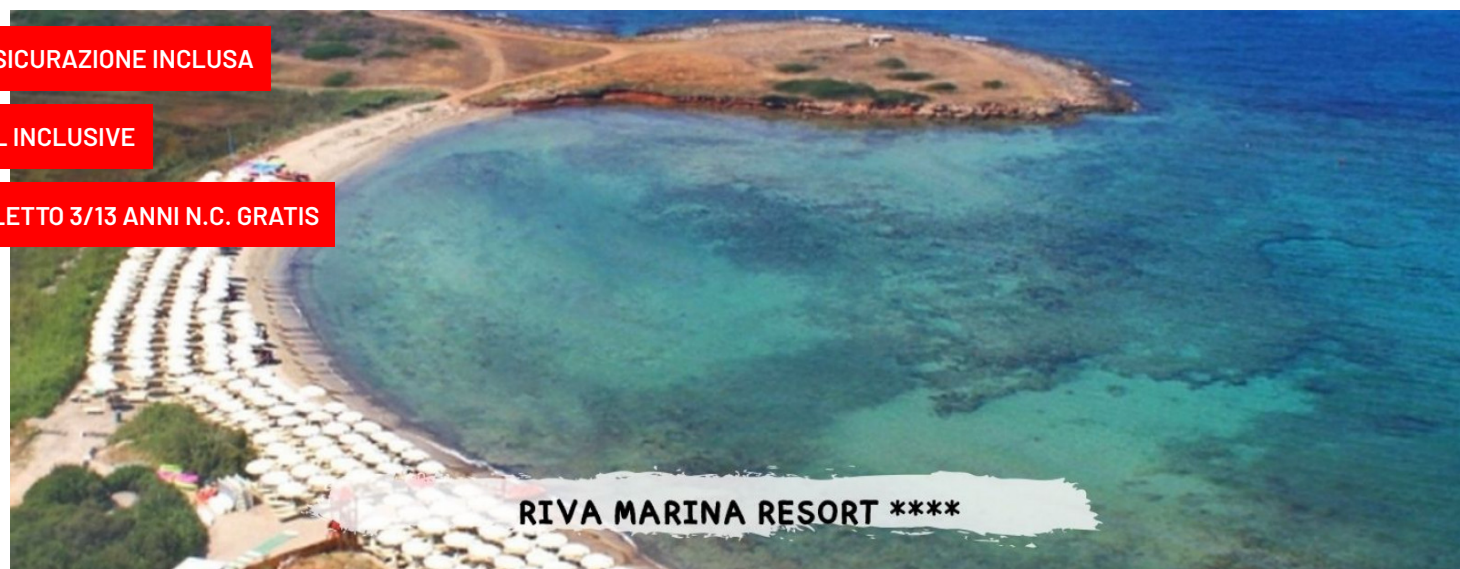
RIVA MARINA RESORT ****