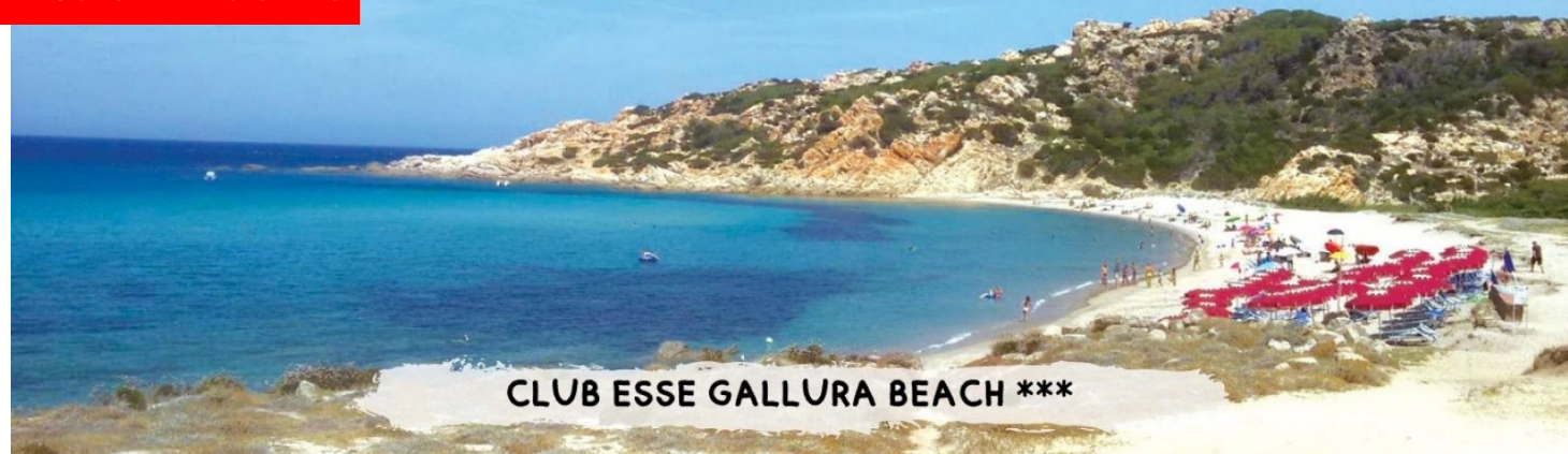
CLUB ESSE GALLURA BEACH ***