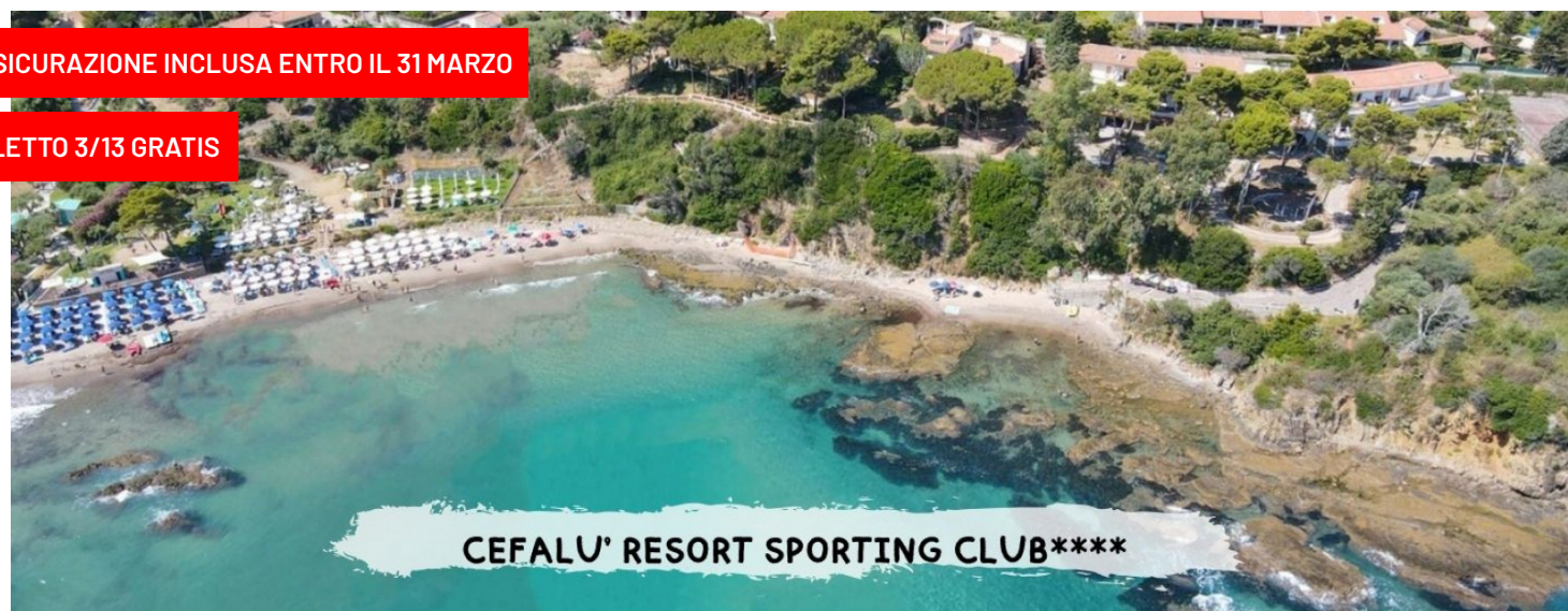
CEFALU' RESORT SPORTING CLUB****

PER LE TUE SETTIMANE SPECIALI CLICCA QUI